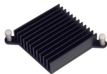
(1) Passiver Kühler mit Clips

Befestigung mittels doppelseitig klebendem Wärmeleittape • Aluminium, grün eloxiert • für Notebooks • Gesamtmaße des Kühlers: (B)35 x (T)35 x (H)6 mm